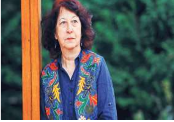
Sevinç Çokum, (d. 25 Ağustos 1943, Beşiktaş, İstanbul)

Hisarcılar akımı temsilcilerinden. Hikâye, roman ve senaryo yazardır. Türk Edebiyatı Vakfı'nın kurucularından biri olan Çokum, Türkiye Gazeteciler Cemiyeti'nin de üyesidir.