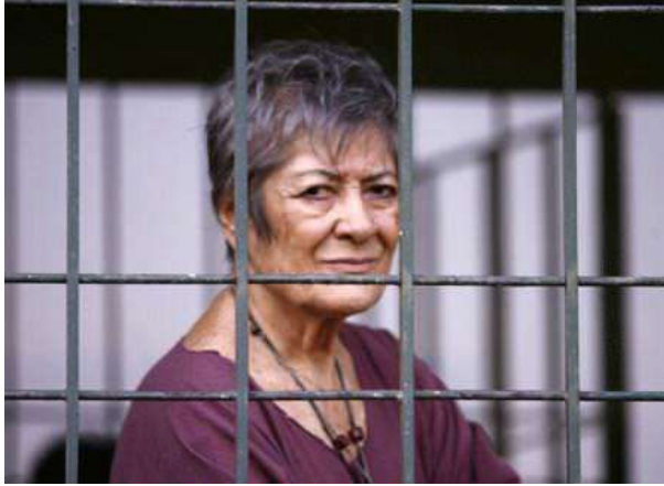
Nezihe Meriç, Nezim, (d. 1925, Gemlik - ö. 18 Ağustos 2009, İstanbul)

adlı küçük bir kitapçıkta bir araya getirildi. Bu kitapta yer alan çoğu Almanca yazılmış metinler, Sezer Duru tarafından Türkçeye çevrildi. Özlü'nün yayımlanmamış senaryosu Zaman Dışı Yaşam da 1993'ten itibaren yazarın tüm yapıtlarını yayımlayan YKY tarafından basıldı. Bu seride, yazarın dostu Leyla Erbil'e yazdığı mektuplardan oluşan Tezer Özlü'den Leyla Erbil'e Mektuplar (1995) da bulunmaktadır