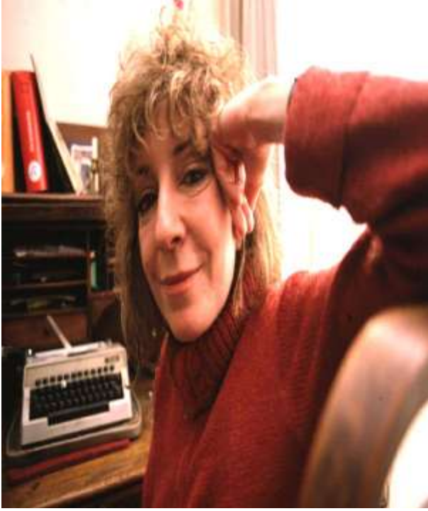
Tomris Uyar (d. 15 Mart 1941 - ö. 4 Temmuz 2003)