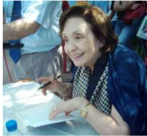
Gülten Dayıoğlu (d. 1935; Emet, Kütahya)

evlilikten Aslı adında bir kızı oldu. Nezihe Meriç'in ilk yazısı olan Ümit İstanbul Dergisi'nde 15 Şubat 1945'te N. Ufuk imzasıyla, ilk öyküsü Bir Şey ise Seçilmiş Hikayeler Dergisi'nde yayımlandı. Korsan Çıkmazı ile 1962 Türk Dil Kurumu, Bir Kara Derin Kuyu ile 1990 Sait Faik Armağanı, Yandırma ile 1998 Sedat Simavi Edebiyat Ödülü'nü, 2007'de ise Mersin Kenti Edebiyat Ödülü'nü aldı. Kanseri tedavisi görmekte olan Meriç, 18 Ağustos 2009'da İstanbul, Etiler'deki evinde hayatını kaybetti. Cenazesi, Zincirlikuyu Mezarlığı'nda toprağa verildi.