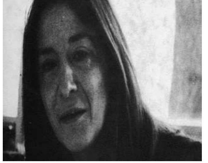
Tezer Özlü (d. 10 Eylül 1943, Simav, Kütahya - ö. 18 Şubat 1986, Zürih, İsviçre)

nedeniyle vefat eden yazarın kabri Zincirlikuyu Mezarlığı'ndadır.