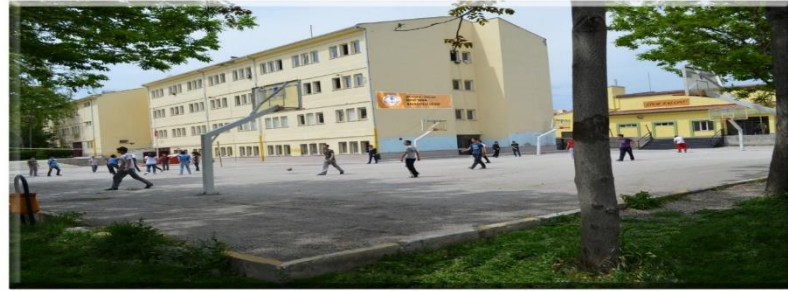
Sincan İbni Sina Anadolu Lisesi